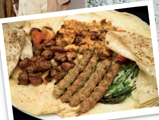
Лепешки с мясным ассорти — сытные иорданские деликатесы.

Шопинг. Акаба является свободной экономической зоной, поэтому тут очень выгодно делать покупки.