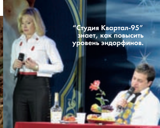
“Студия Квартал-95” знает, как повысить уровень эндорфинов.