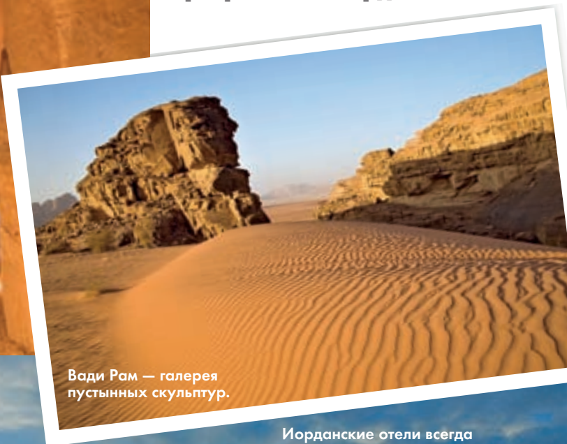
Вади Рам — галерея пустынных скульптур.