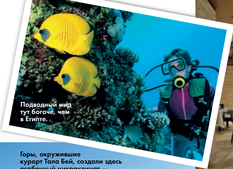
Подводный мир тут богаче, чем в Египте.