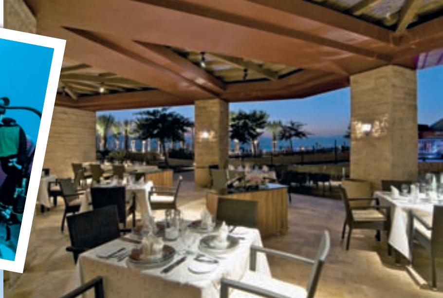
Ужин при свечах на берегу Красного моря.

Горы, окружившие курорт Тала Бей, создали здесь особенный микроклимат — безветренный и мягкий.