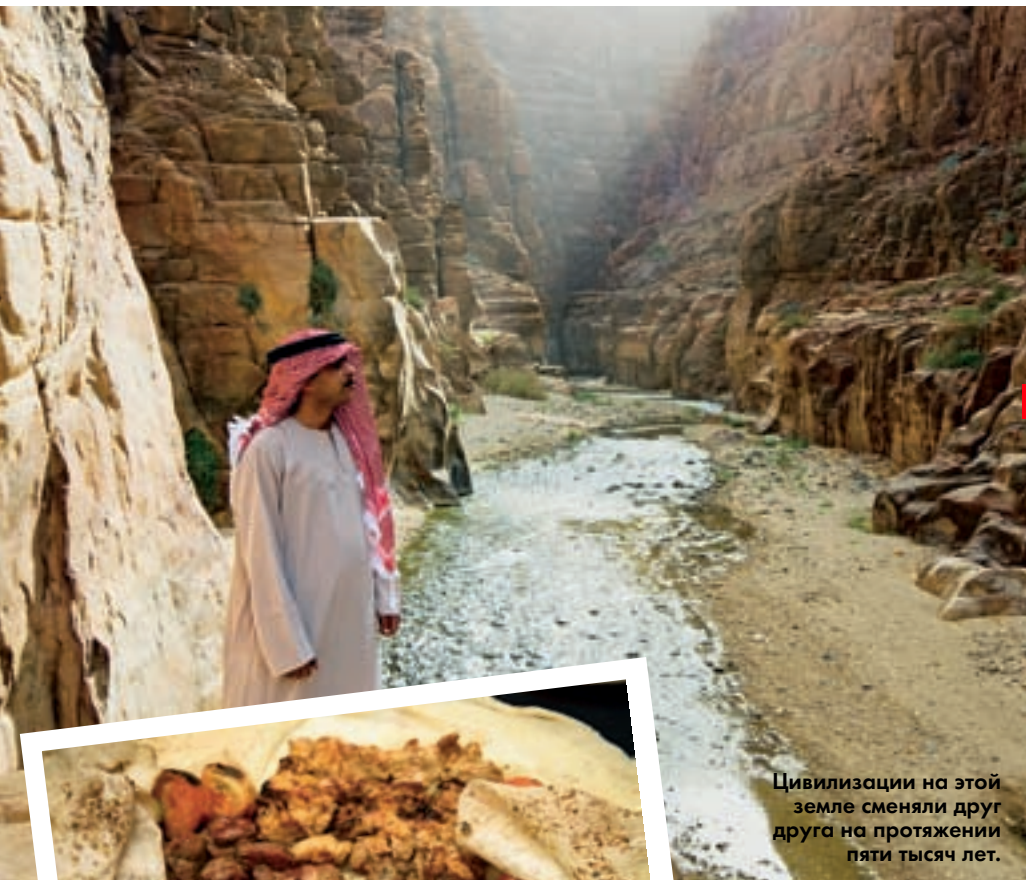
Цивилизации на этой земле сменяли друг друга на протяжении пяти тысяч лет.