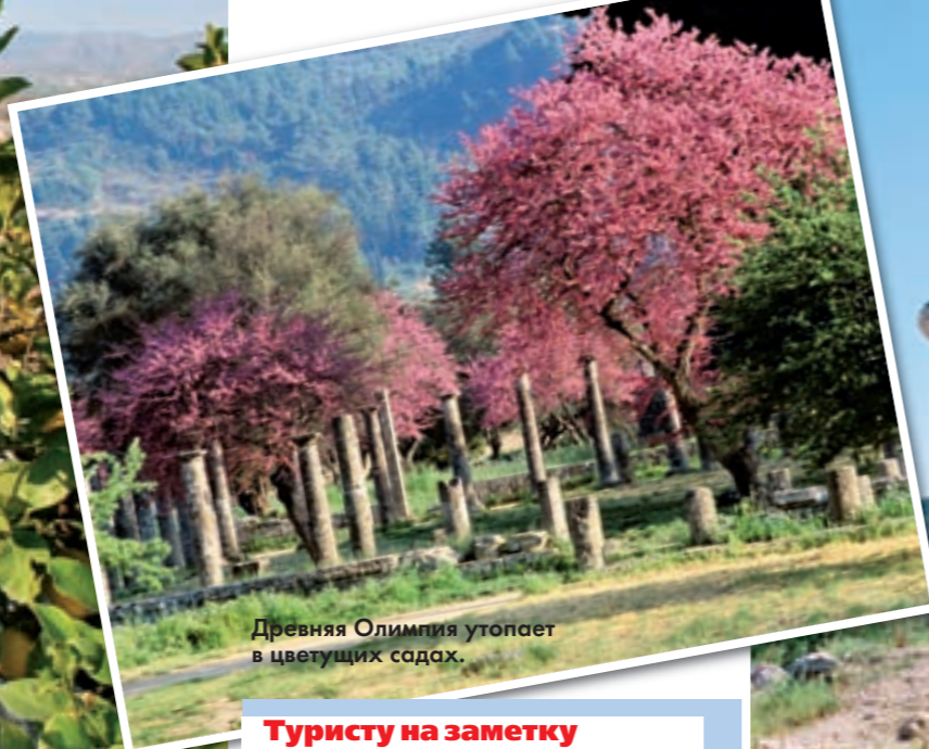
Древняя Олимпия утопает в цветущих садах.