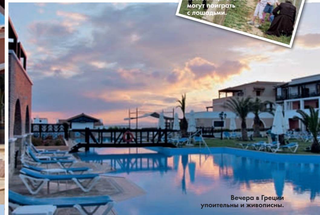
Вечера в Греции упоительны и живописны.