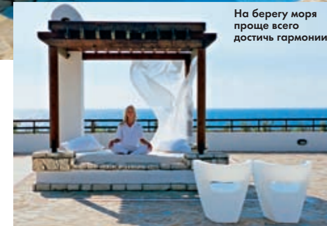
На берегу моря проще всего достичь гармонии.

www.aldemarhotels.com — на этом сайте можно совершить виртуальную экскурсию в номера отелей и узнать все о питании, услугах, развлечениях и экскурсиях. www.cita.kiev.ua — информация о турах в Грецию.