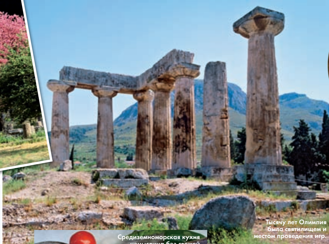
Тысячу лет Олимпия была святилищем и местом проведения игр.