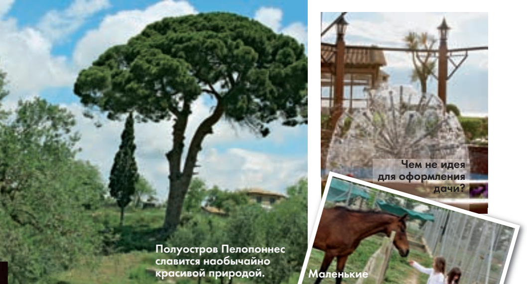
Полуостров Пелопоннес славится необычайно красивой природой.