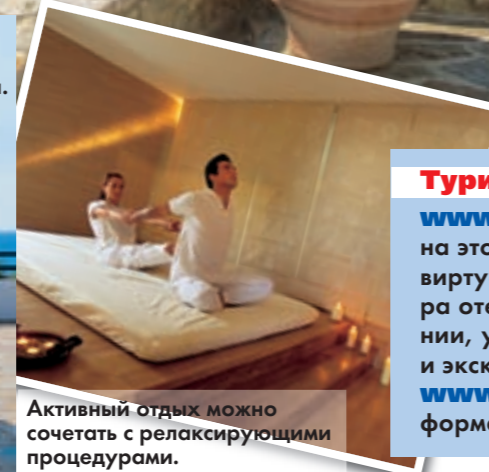
Активный отдых можно сочетать с расслабляющими процедурами.