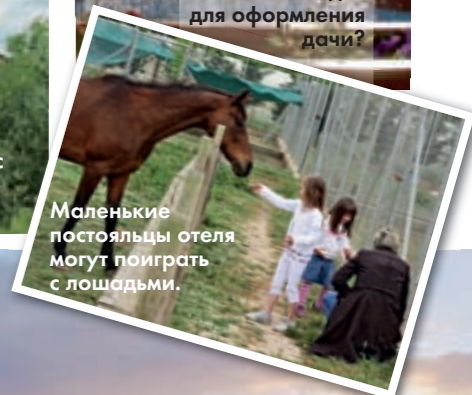
Маленькие постояльцы отеля могут поиграть с лошадьми.