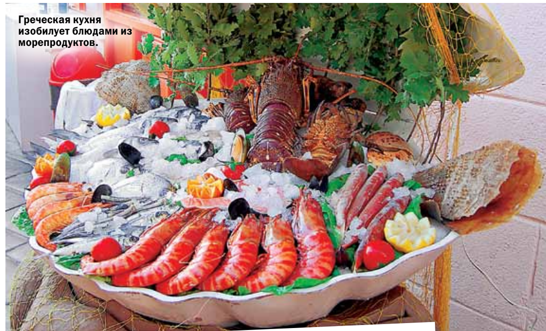
Греческая кухня изобилует блюдами из морепродуктов.