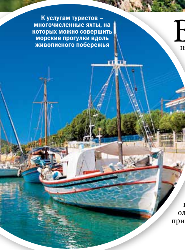
К услугам туристов – многочисленные яхты, на которых можно совершить морские прогулки вдоль живописного побережья

Отправляясь на Халкидики, приготовьтесь не только прекрасно отдохнуть и оздоровиться, но и прикоснуться к вечности, увидев легендарную гору Олимп, на которой, согласно древнегреческой мифологии, жили боги