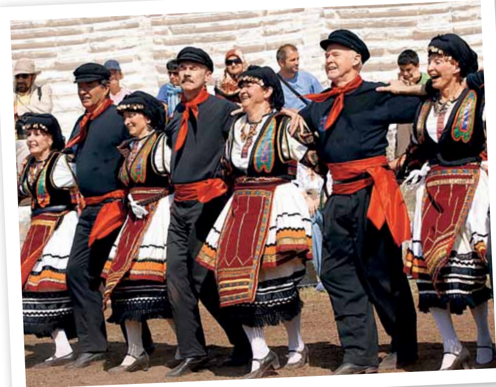
Греция... Стоит произнести это слово, и в ушах начинает звучать зажигательная музыка сиртаки, перед глазами встают живописные оливковые рощи на фоне каменистого пейзажа и лазурной морской глади, а во рту явственно ощущается вкус апельсинов