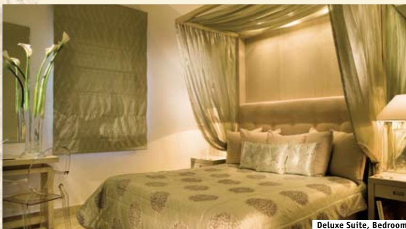
Deluxe Suite, Bedroom

Two Bedrooms Family Suites (семейные сюиты, 90 м 2 , тах 2 взрослых + 3 детей или 3 взрослых + 2 детей). Вид на сады и бассейн. Расположены на 1-м этаже. Состоит из двух спальных комнат и отдельной гостиной, двух ванных комнат. Мраморный пол.