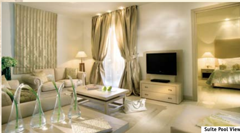
Suite Pool View

Deluxe Suites (Делюкс сюиты, 60 м 2 , тах 3 взрослых + 1 ребенок или 2 взрослых + 2 детей). Вид на гавань или бассейн. Расположены на 2-м этаже. Состоят из спальни и отдельной гостиной, ванной комнаты, мебелированного балкона. Мраморный пол.