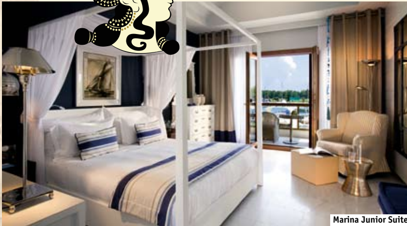
Marina Junior Suite

10 Marina Junior Suites (Марина Джуниор сюиты, примерно 40 м 2 , тах 2 взрослых). Отдельный корпус номеров, расположенный в гавани Sani Marina, все номера находятся на втором этаже с видом на гавань и оформлены в морском стиле. При заезде гости сопровождаются до номера; преподносится бутылка фирменного греческого вина и корзина с фруктами, гости пользуются основным рестораном отеля. Рекомендуются для молодежи и любителей активного отдыха.