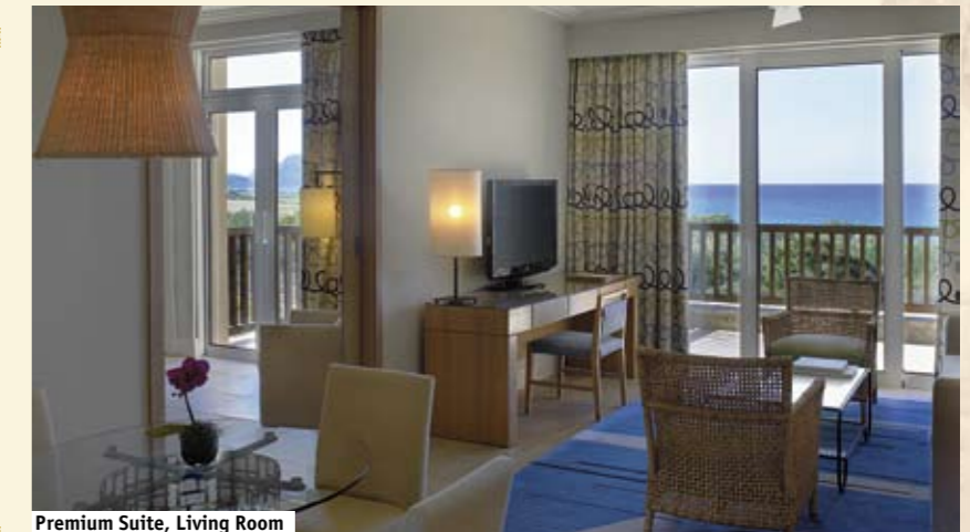
Premium Suite, Living Room