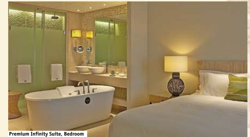
Premium Infinity Suite, Bedroom