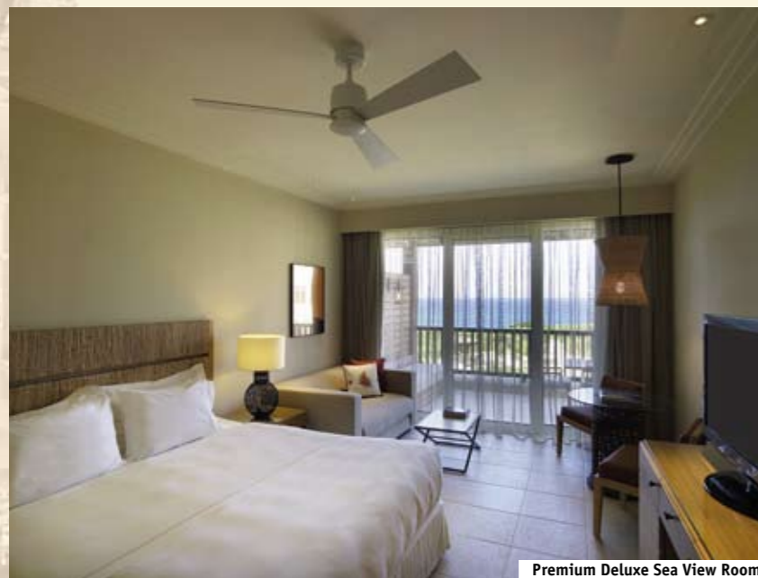
Premium Deluxe Sea View Room

22 Superior Rooms (49 м², max 3 взрослых). Номера с отдельной зоной отдыха с 2-мя односпальными диван-кроватьями и зоной спальни. Вид на бассейны курорта. Расположены на 1-м этаже.