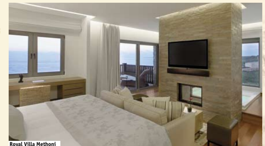
Royal Villa Methoni